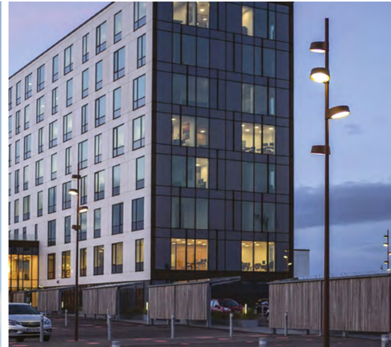
NYX 330 avec option fixation pour mât traversant