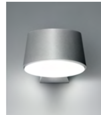
NYX 190 Applique murale