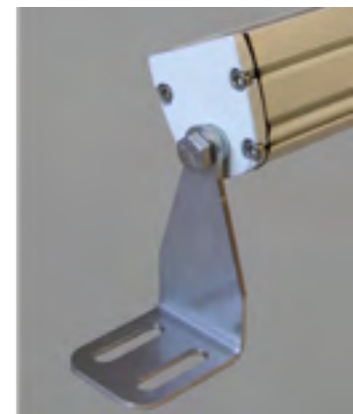
Équerre Haute (50mm)