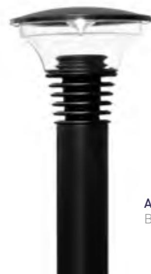
Association Borne BECCO PARK