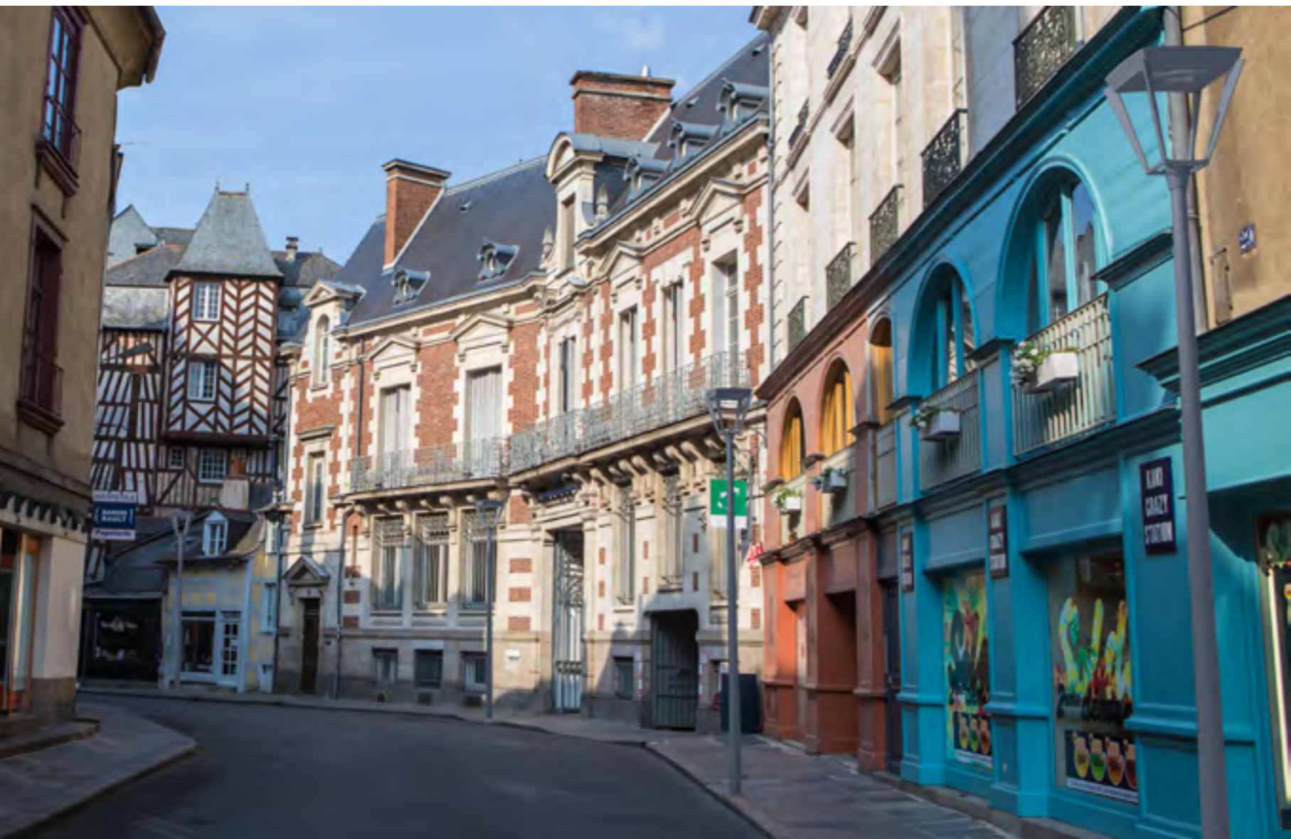
CORDOBA et optique confort PLUS pour les centres piétons