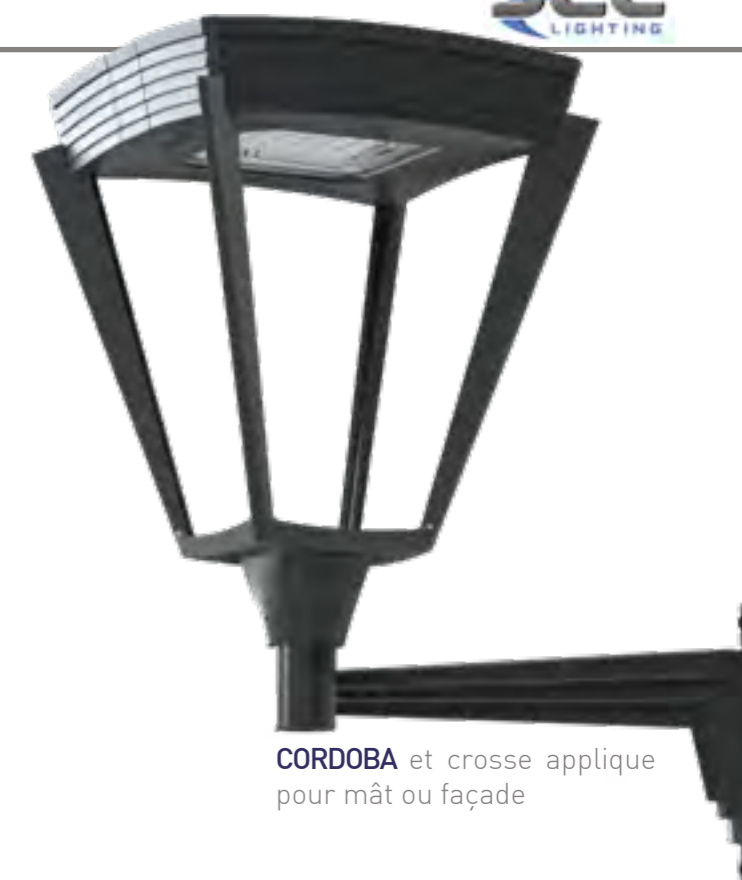
CORDOBA et crose applique pour mât ou façade