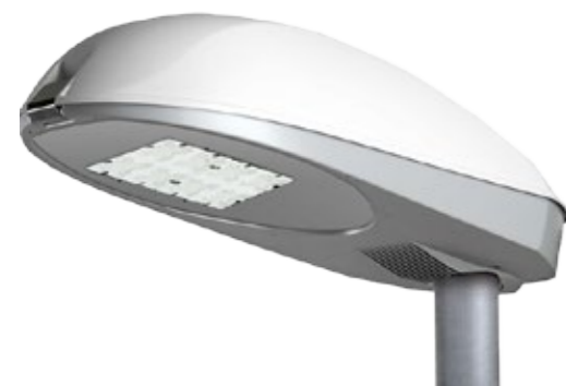
ESTILO Moteur LED