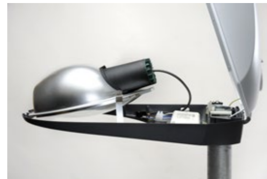
Accessibilité maximum ouverture et changement de la lampe sans outil