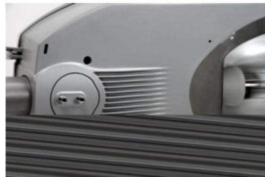
Montage Crosse diamètre 42/49/60mm Montage Top diamètre 60/76mm